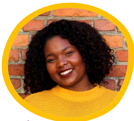
ANA AUA SÓ

Onze inzet om een einde te maken aan VGV in Europa en daarbuiten zou onvolledig en onhoudbaar zijn zonder de volgende generatie activisten te mobiliseren, voor te bereiden en daarmee samen te werken voor de taken die ons nog wachten. End FGM EU gelooft dat kinderen en jongeren een uniek perspectief en potentieel hebben om deze verandering te bewerkstelligen , als zij worden opgeleid en/of het mandaat krijgen om hun rol te spelen bij het bevorderen en beschermen van de rechten van vrouwen en meisjes. Voor dit doel omarmt End FGM EU jongeren uit door VGV getroffen diaspora-gemeenschappen als kernpartners bij het beëindigen van VGV en werken wij actief aan een op jongeren gerichte aanpak. Om dit doel te bereiken zijn we in 2017 gestart met een programma voor Jongerenambassadeurs, een veilige plek waar jongeren uit verschillende EU-landen elkaar kunnen ontmoeten, contacten kunnen leggen, ervaringen met elkaar kunnen delen en kunnen bijdragen aan het werk van het End FGM Netwerk.